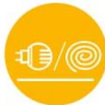
Diffuseurs électriques Serpentins à l'extérieur