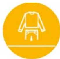
Vêtements amples et couvrants