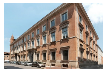
Hôtel Saint-Jean, Toulouse