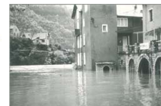
Sainte-Enimie / crue de 1892