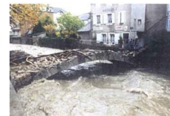
Meyrueis- crue de 1994 Photo prise à la décrue le 05 novembre entre 8h00 et 11h00