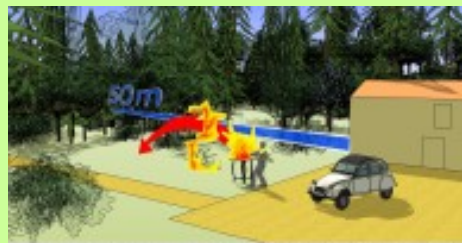
Pour protéger la forêt (risque induit)