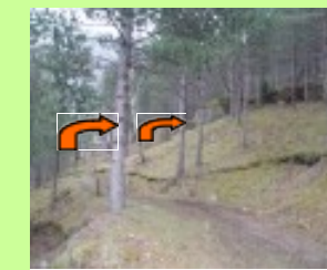
Élaguer les arbres conservés

En aucun cas « débroussailler » ne signifie « couper tous les arbres ». Ce n'est pas un défrichage !