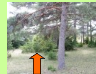
Éliminer les broussailles

Éliminer les rémanents = réduire l'intensité de l'incendie