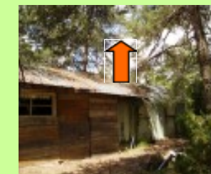
Séparer les arbres