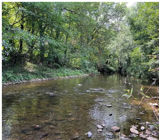
Illustration 2 : Vues sur la Colagne dans la zone de projet