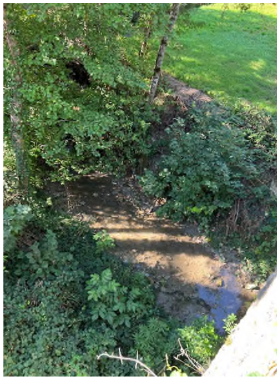
Illustration 1 : Vues sur la Jourdane en amont (à gauche) et en aval (à droite) du pont du Qur du Pont Pessil en amont direct de la Colagne