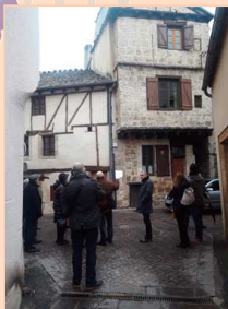
Maison rue Amédée Monteils à Mende

Cette première approche du contexte territorial sera complétée, à l'occasion de l'Atelier n°1 d'avril prochain, par un parcours de l'ensemble de la communauté de communes aux côtés des élus.