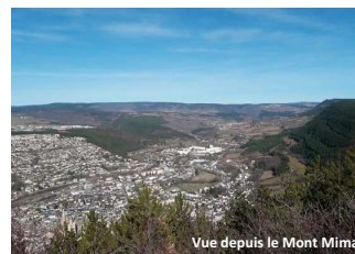
Vue depuis le Mont Mimat

Mende Communauté de Communes Cœur de Lozère