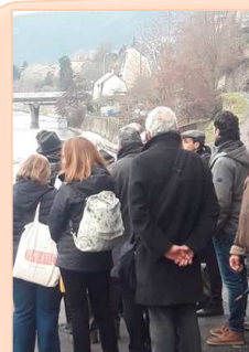
Sur les rives du Lot