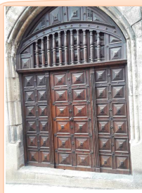
Porte rue d'Aigues Passes à Mende