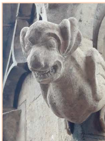
Gargouille de la Cathédrale de Mende

Cette approche nécessite d'identifier les complémentarités entre les cœurs de villes et les périphéries, de prendre en compte les modes de vie des habitants pour traiter les questions actuelles : le confort du logement en lien avec les besoins de mobilités diversifiées et le stationnement, la requalification de l'espace public, l'offre de services et de commerces, etc. L'appropriation du patrimoine et son intégration pleine et entière dans le quotidien passe par de nouvelles alliances entre la société civile et les professionnels pour enrichir le projet de territoire de leur expertise d'usage. La démarche Atelier des territoires propose un espace de dialogue à toutes les parties prenantes pour construire un projet de territoire où les lieux patrimoniaux seront des atouts pour revaloriser la ville contemporaine.