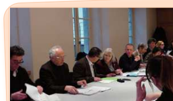
Le comité présidé par madame la Préfète et monsieur le Maire de Mende