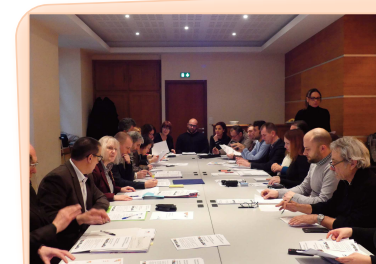
Les membres du comité de pilotage réunis le 15 février 2018