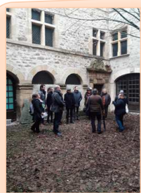
Hôtel Ressouches, rue de l'Épine à Mende