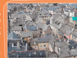
Les toits de Mende