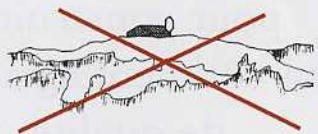
Implantation en crête à éviter

Un bâtiment agricole n'est pas une construction anodine. Il marque le paysage durablement aussi, il convient d' éviter des implantations en ligne de crête où l'impact paysager est le plus fort et où le bâtiment sera le plus exposé aux intempéries.