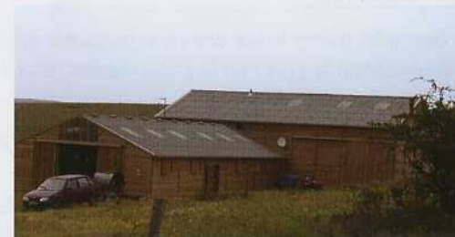
La Citerne - Causse Méjean