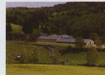
Graniboules - Le Fau de Peyre

Les couvertures ayant un impact paysager très fort, il convient que celles-ci soient d'une couleur plus foncée que les murs afin de diminuer visuellement le volume du bâtiment.