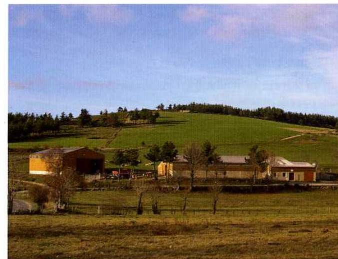
La Bataille de Grandrien